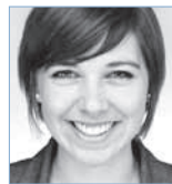
Inhalt & Konzeption Nelli Hajdu IIR Deutschland